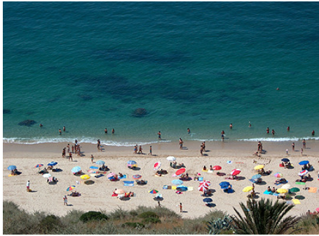
Stranden ved Sesimbra

Der er i området et væld af smukke og spændende seværdigheder fx Klipperne ved "Cabo Espichel", Naturparken "Arrabida", Lagunen "Lagoa de Albufeira" og naturligvis Lissabon by.