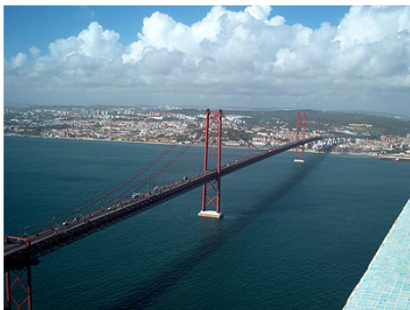
Udsigt over Lissabon fra Christo Rei